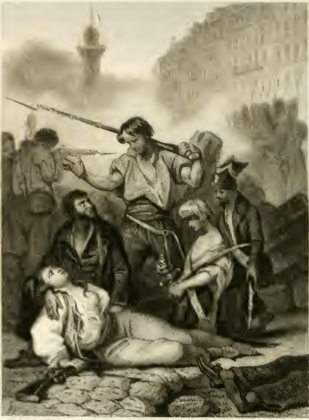
THE BARRIERS OF THE CITY.